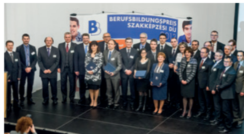
A 2013/14. évi Szakképzési Díj átadása, 2014. február 27-én.