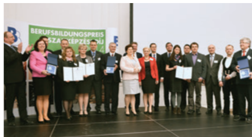
A 2014/15. évi Szakképzési Díj átadása, 2015. március 12-én.